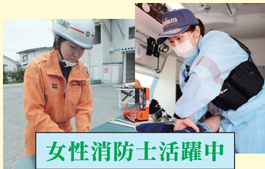
女性消防士活躍中