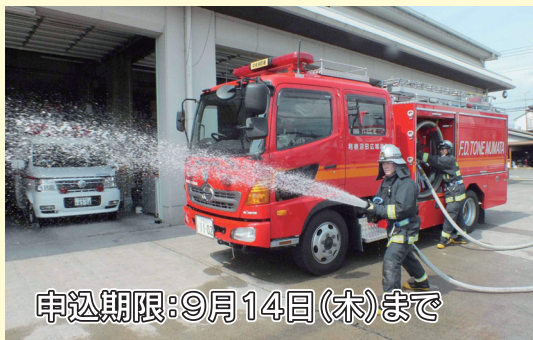
申込期限：9月14日（木）まで