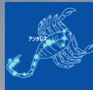
6月さそり座のお話