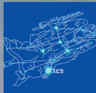
5月おとめ座のお話

発行者 利根沼田広域市町村圏振興整備組合 / 住所 〒378-0051沼田市上原町1801番地2 ☎0278(22)3691