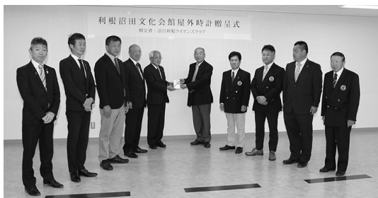
↑9日に行われた贈呈式の様子

今後にも利根沼田の文化振興のため、来館した皆さまが快適にご利用いただけるよう努めてまいります。