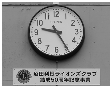
→寄贈された屋外壁掛時計