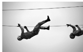
ロープブリッジ救出