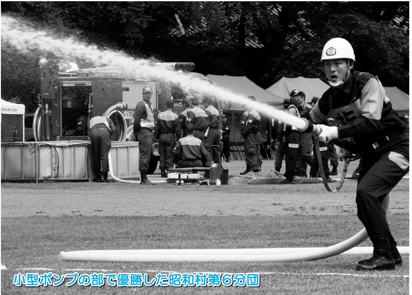
小型ポンプの部で優勝した昭和村第6分団

発行者 利根沼田広域市町村圏振興整備組合 / 住所 〒378-0051沼田市上原町1,801番地2 ☎0278(22)3691