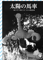
【6月】 さそり座にまつわる物語