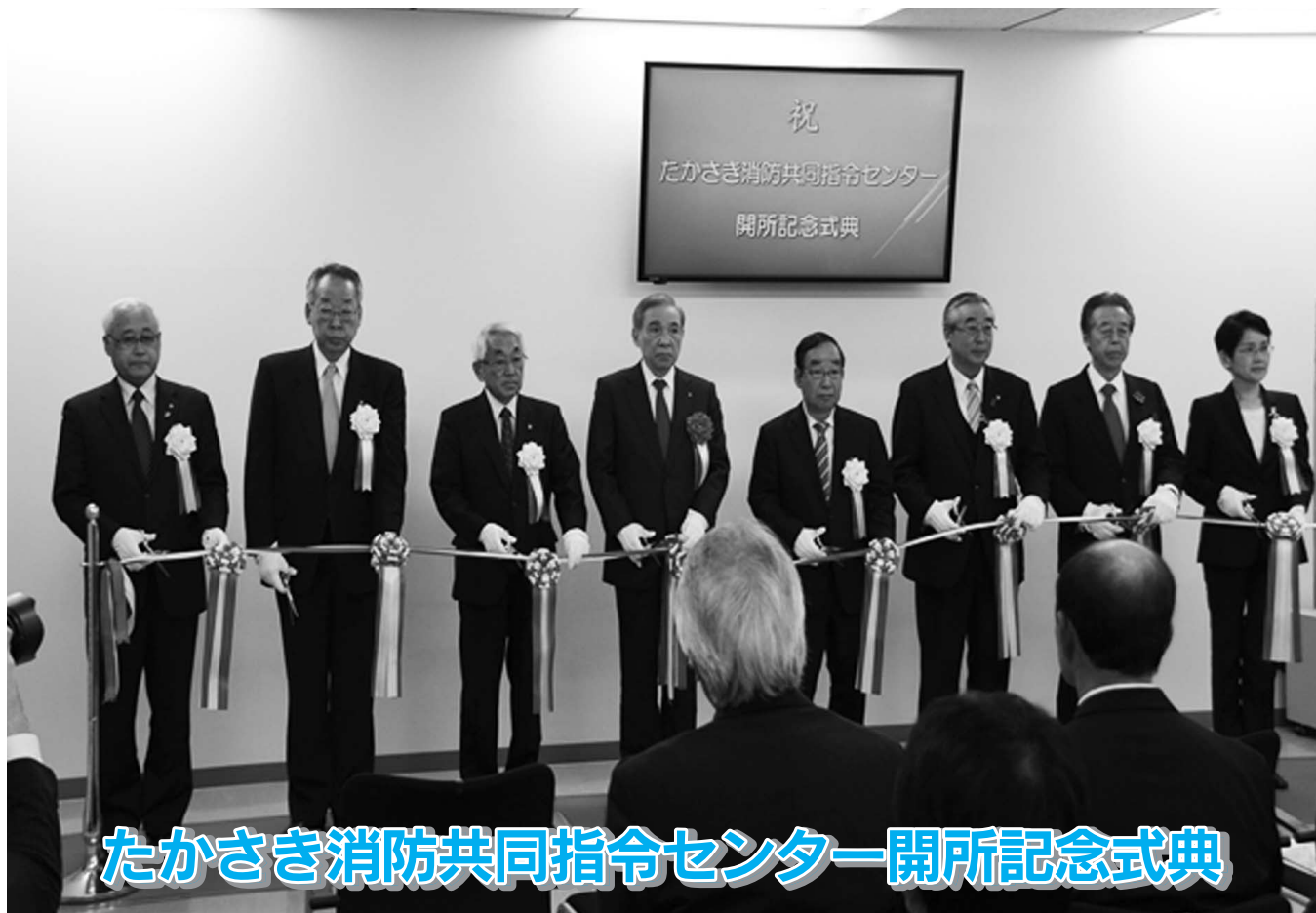
たかさき消防共同指令センター開所記念式典

発行者 利根沼田広域市町村圏振興整備組合 / 住所 〒378-0051沼田市上原町1,801番地2 ☎0278(22)3691