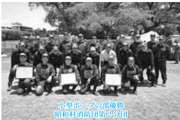
小型ポンプの部優勝 昭和村消防団第2分団