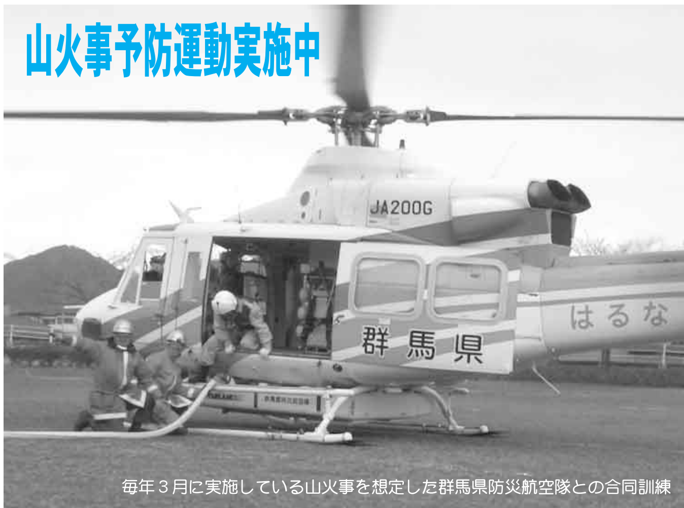
毎年3月に実施している山火事を想定した群馬県防災航空隊との合同訓練