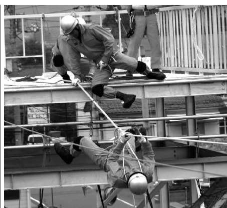
大会前に訓練に励む選手たち