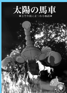
【6月】 さそり座にまつわる物語