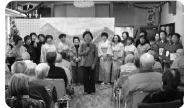
■沼田市婦人会による交流会の様子