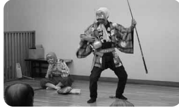
■面友会によるバカ面踊り披露の様子