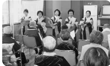
■沼田たばこ販売協同組合による舞踊披露の様子