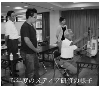
昨年度のメディア研修の様子

開催日 8月17日(日) 申込締切 7月31日(木) 募集人員 20人 ※定員になりしだい 締め切ります。 受講料 無 料 申込み先 利根沼田広域圏 視聴覚ライブラリー (文化会館内)