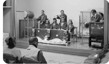
■高橋場祭り囃子保存会による祭り囃子演奏の様子