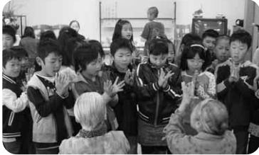
■沼田北小学校による交流訪問の様子

愛宕・猿ヶ京両老人ホームでは、様々なボランティア団体の方々がホームで生活しているお年寄りとの交流活動にご尽力いただいております。また、ボランティアの方々だけでなく、地域の園児や小中学生、高校生等の福祉体験学習をとおしての交流等も行われております。