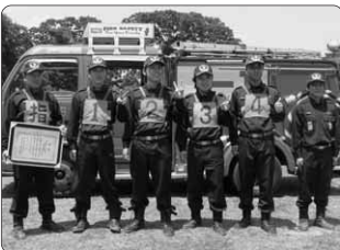
■自動車ポンプの部で優勝した 沼田市第1分団第1部A

自動車ポンプの部で優勝・準優勝チーム、小型ポンプの部で優勝チームが、平成20年8月20日(水)に群馬県消防学校において開催される県大会に出場します。