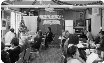
■詩吟クラブによる誕生会お祝いの様子