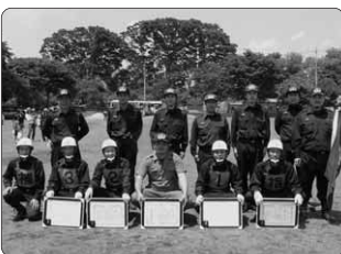
■小型ポンプの部で優勝した 昭和村第5分団