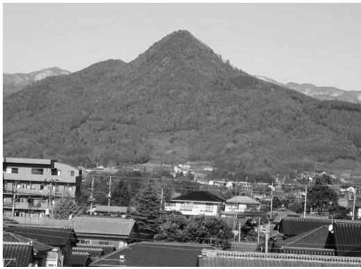
【平成5年の山火事から15年目を迎えた戸神山】