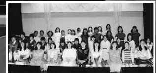
児童合唱：沼田ユネスコ少年少女合唱団