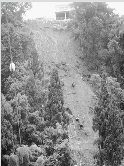
～7月19日沼田市下久屋町で発生した土砂崩れ～

これから台風が多く発生する季節になります。過去の台風をみると、夏以降の台風は比較的大きな台風に発達し、全国各地に大きな被害を及ぼすような気がします。台風は進路と規模等が事前に天気予報で予想されますので、自分自身で事前対策を講じることが可能です。台風情報をよくチェックするとともに、家族で万が一の場合に備え対策を話し合っておきましょう。また、台風以外でも、大雨や長雨が続いた時には、山の動きや木の動き、川の流れ等を確認し、普段と何かが違うと感じたら避難等をしてください。土砂崩れや災害の心配があります。このように普段から、家族全員で家の周りや通学・通勤路等の危険箇所を調査しておくことも大切な事だと思います。